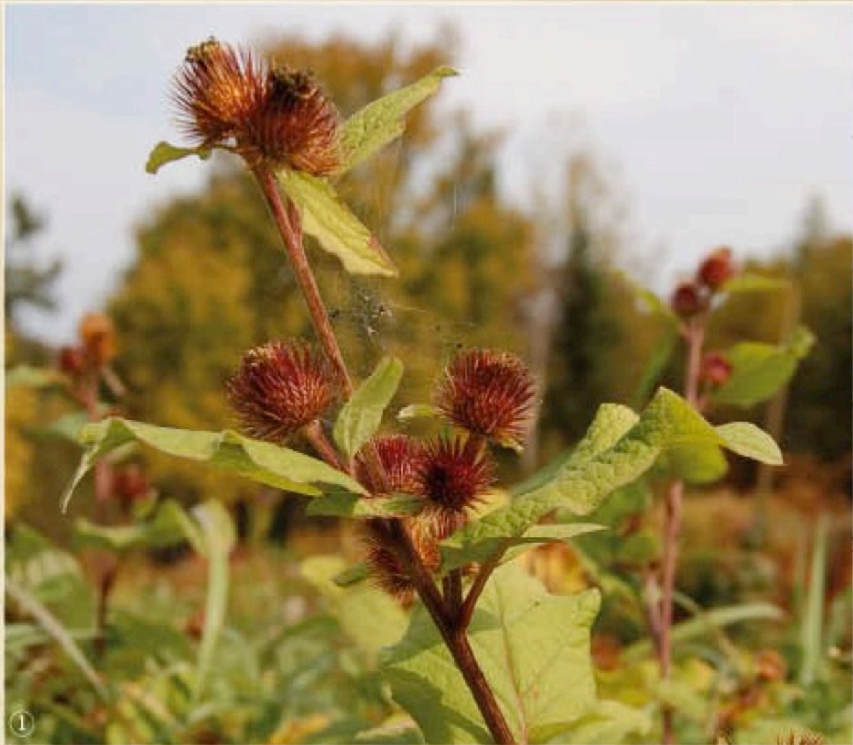
BARDANE Arctium lappa L.