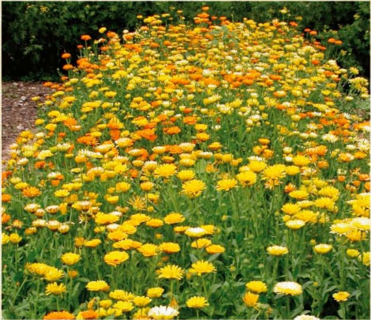
CALENDULE Calendula officinalis L.