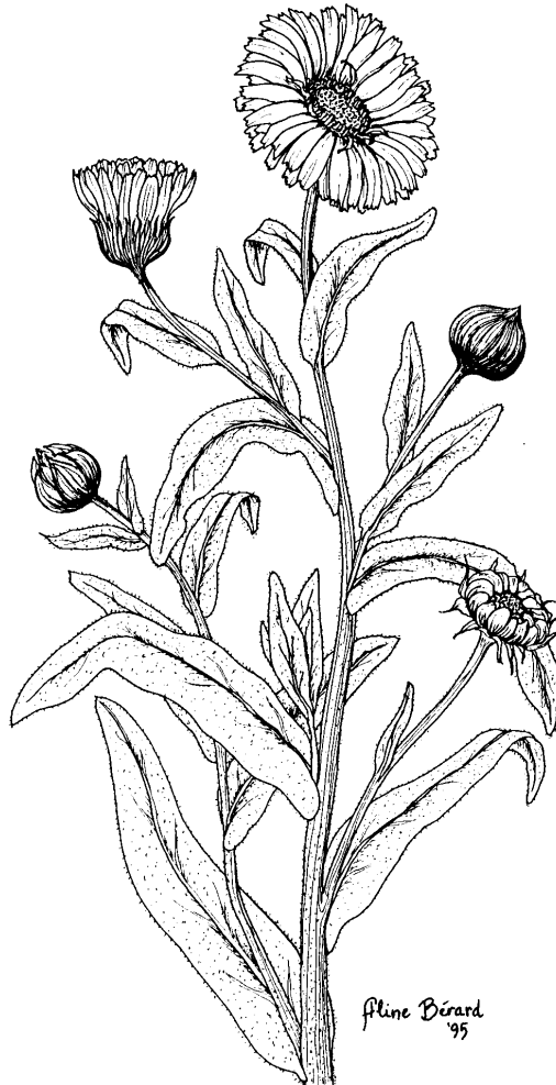
CALENDULE Calendula officinalis L.