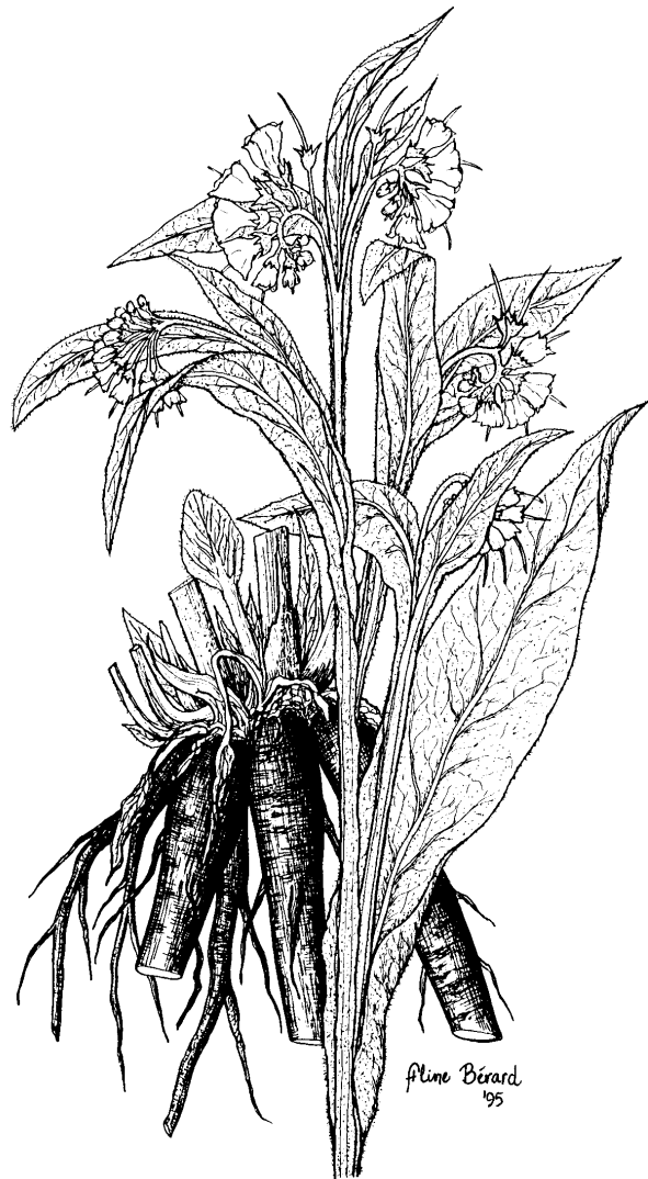
CONSOUDE Symphytum officinale L.