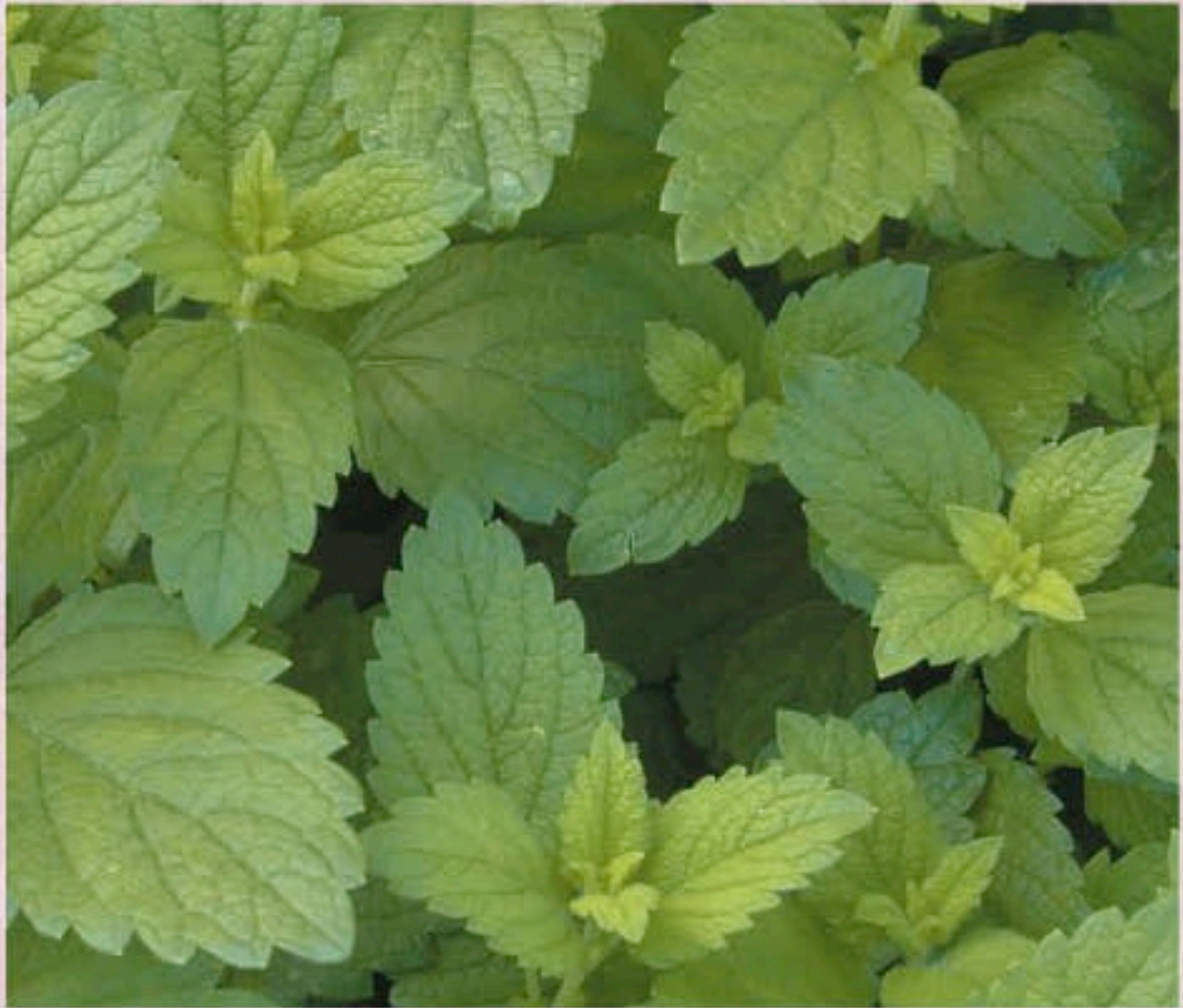
MÉLISSE Melissa officinalis L.