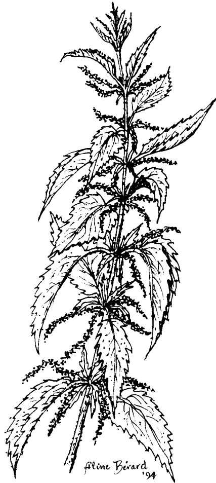
ORTIE Urtica dioica L.