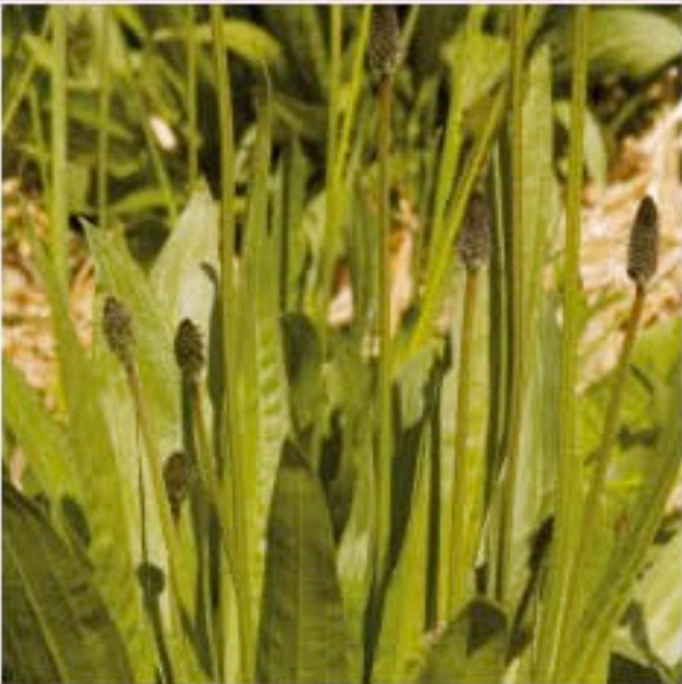
Plantain lancéolé ( Plantago lanceolata L.)