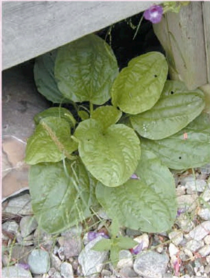
PLANTAIN Plantago major L.