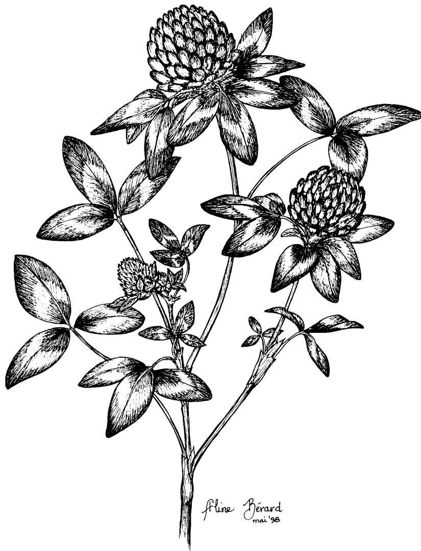
TRÈFLE ROUGE Trifolium pratense L.