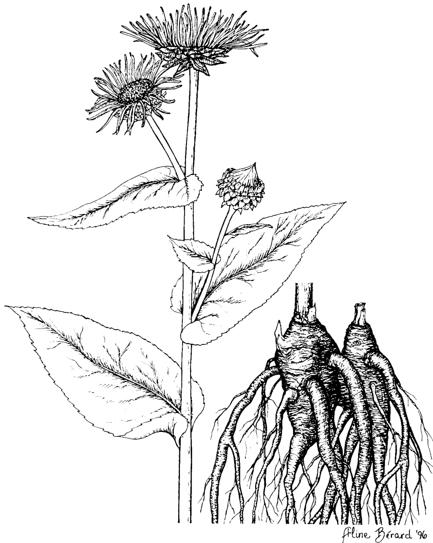
AUNÉE Inula helenium L.