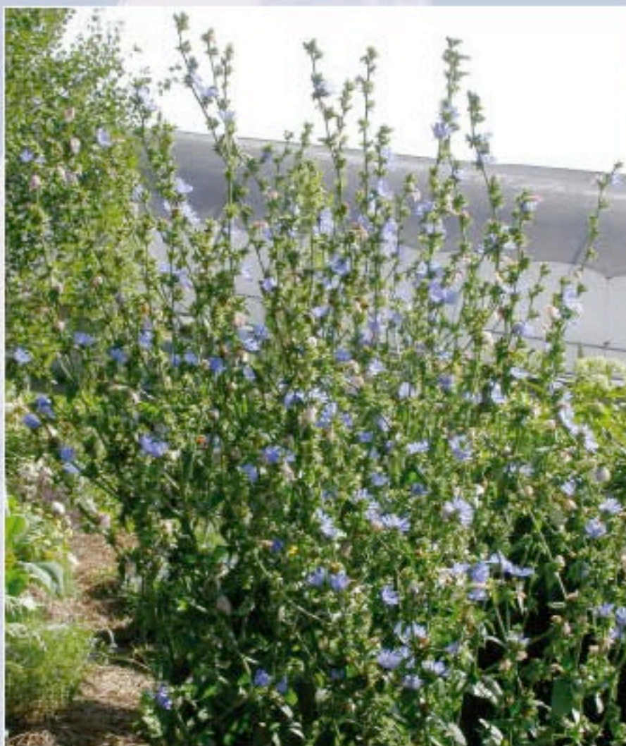
CHICORÉE Cichorium intybus L.