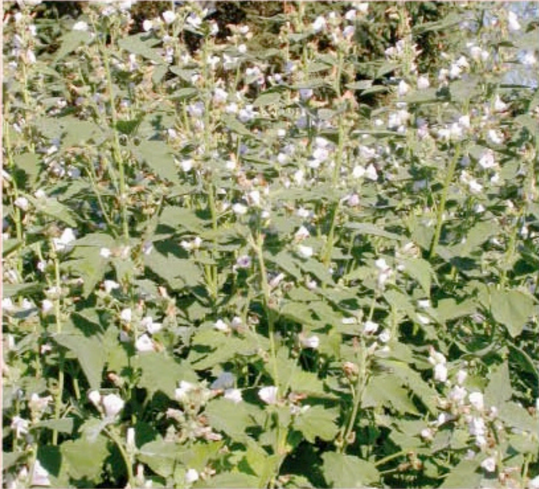
GUIMAUVE Althaea officinalis L.