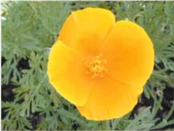
Pavot de Californie