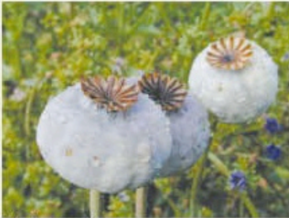
Fruits du pavot somnifère