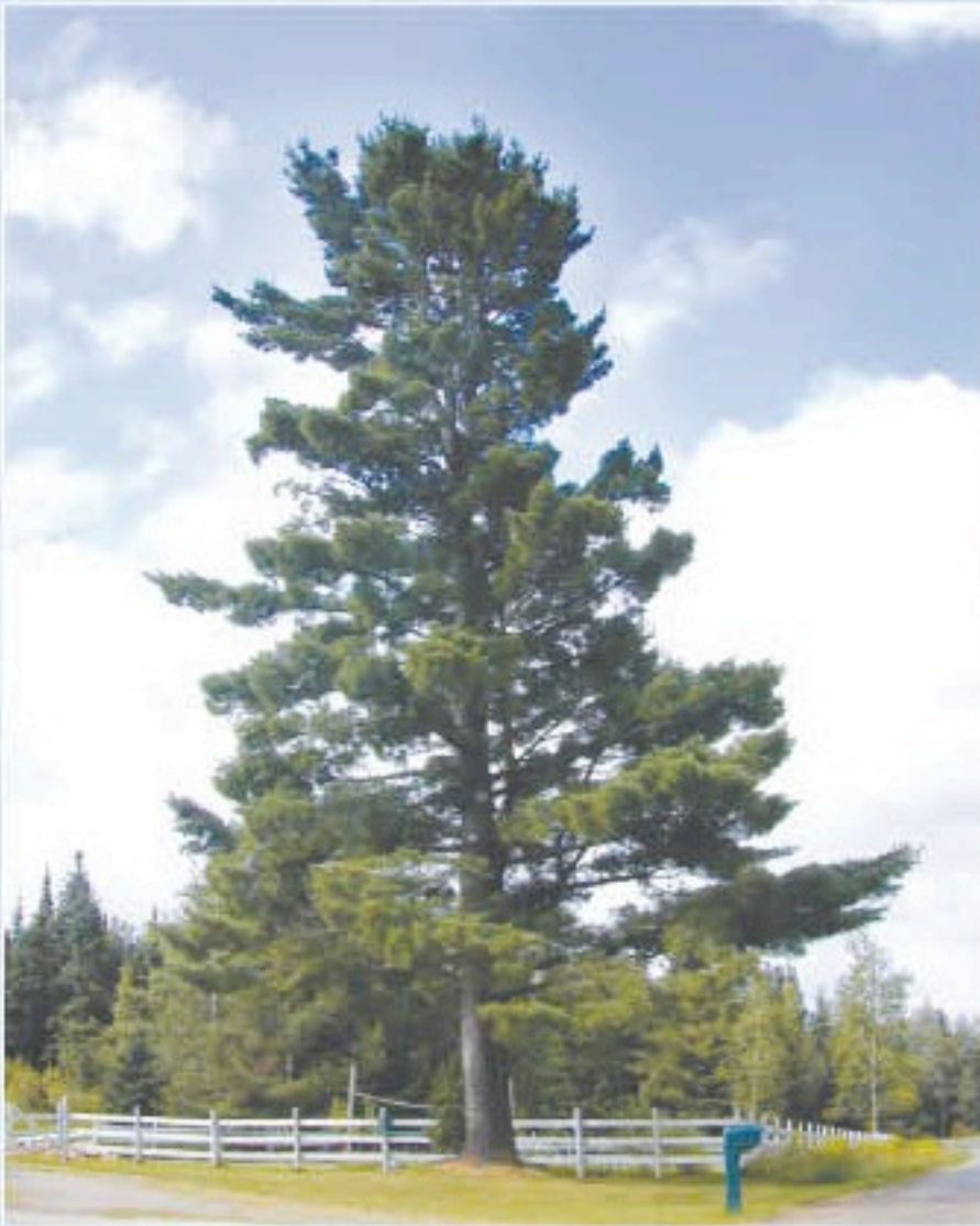
PIN Pinus spp.