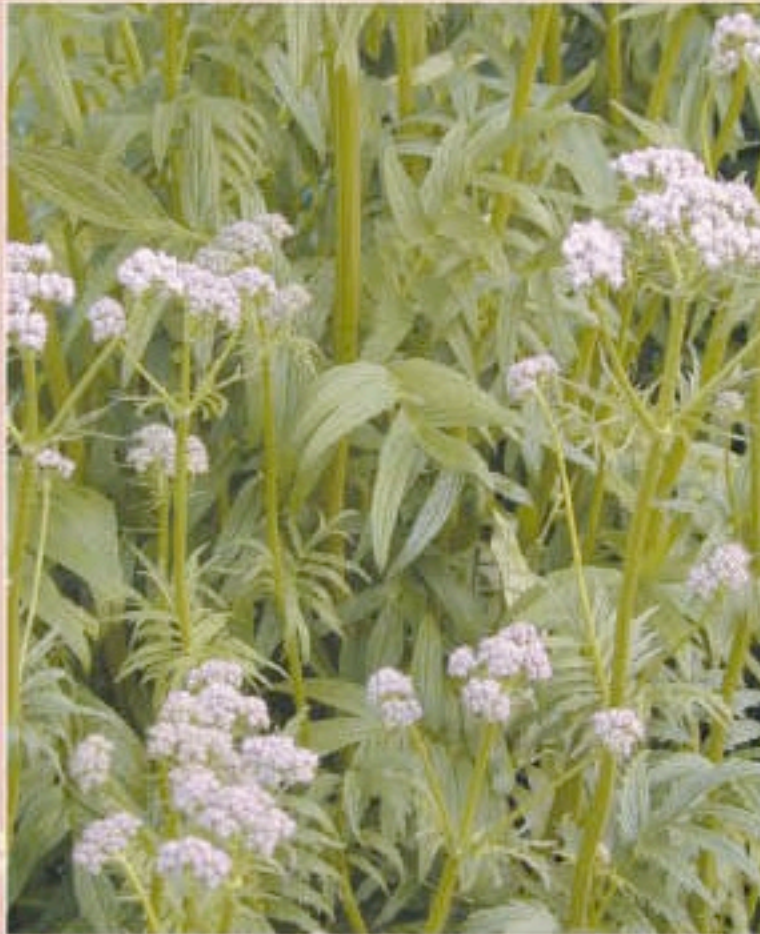
VALÉRIANE Valeriana officinalis L.