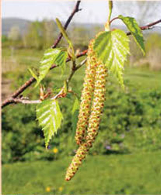
Feuilles et fleurs du bouleau gris